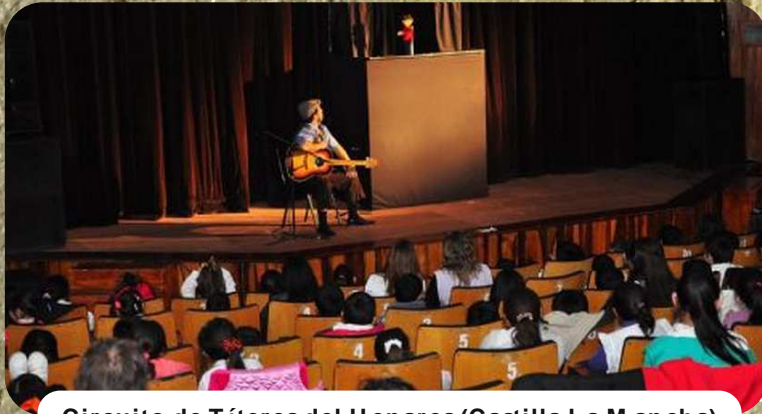
Circuito de Títeres del Henares (Castilla La M ancha)