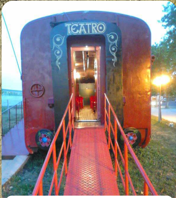
Vagón de los Títeres - M ar del Plata (ARG)