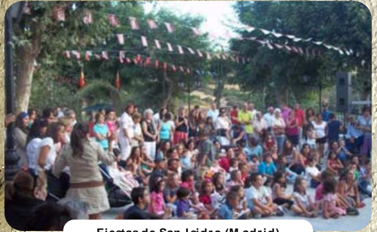
Fiestas de San Isidro (M adrid)